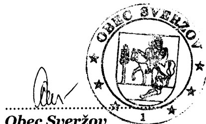
Obec Sveržov Pavol Ceľuch objednávateľ